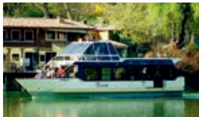
VALENTINO - 110 pax