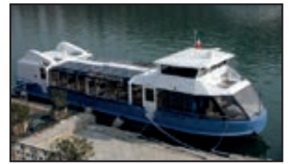
ERIDANO - 100 pax