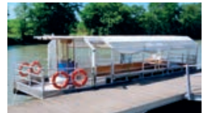
LA ROSSO BLU - 40 pax