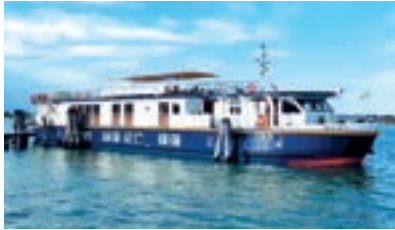
LA BELLA VITA - MERY 20 pax CROCIERE SETTIMANALI