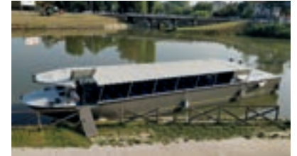
SANT'AGOSTINO - 80 pax