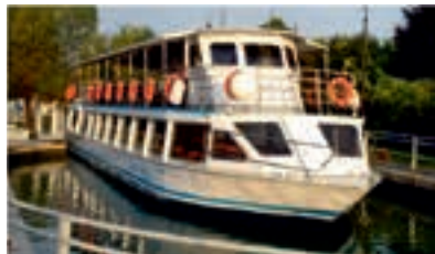
CITTÀ DI PADOVA - 210 pax