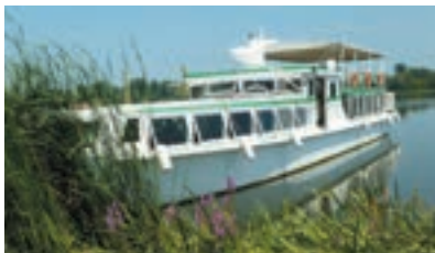
ANDES I - 280 pax