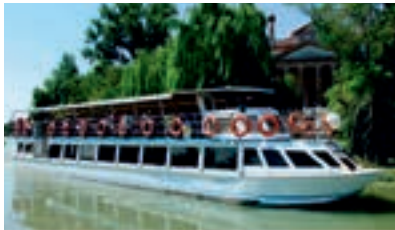
DELTA PATAVIUM - 230 pax