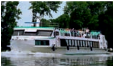
ANDES 2000 - 550 pax