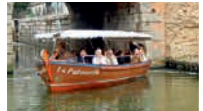
LA PADOVANELLA 1932 - 50 pax