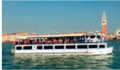
DELTA TOUR - 250 pax