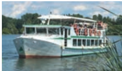
ANDES II - 200 pax